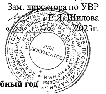
График работы Школ здоровья Общественной Академии ЗОЖ на 2 полугодие 2023– 2024 учебный год