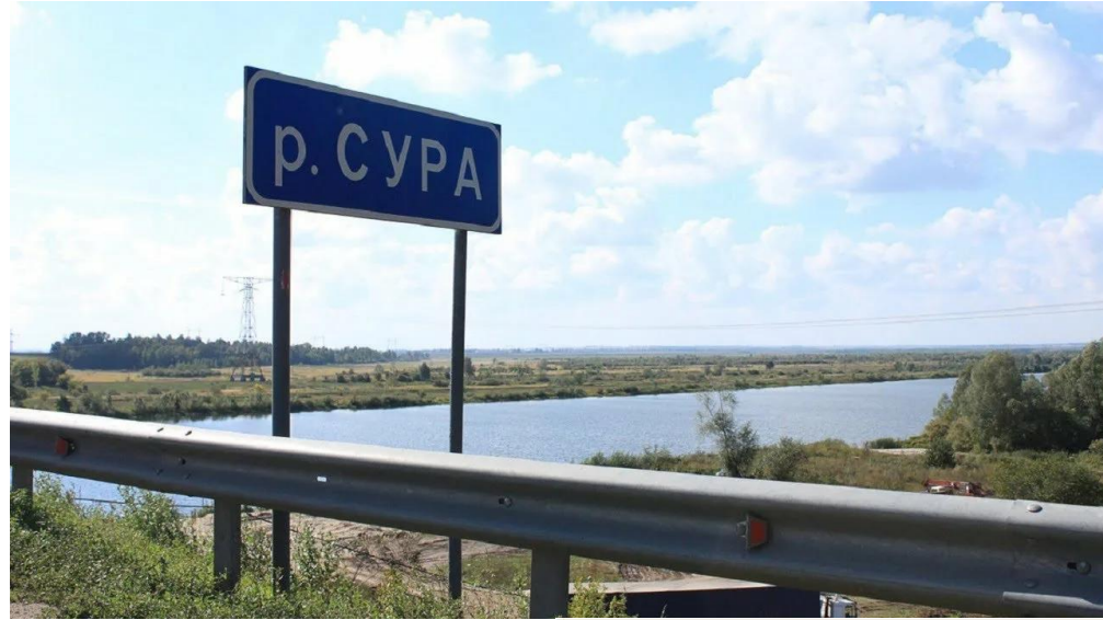
Живописные места Бутурлинского заказника