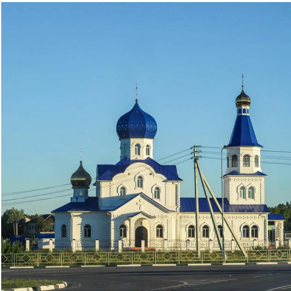
Собор Рождества Пресвятой Богородицы