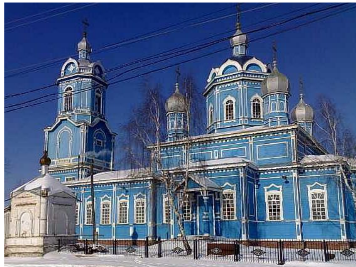
Храм Николая Чудотворца